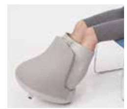
傾けて使用できます