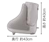
高さ 約43cm 奥行 約43cm